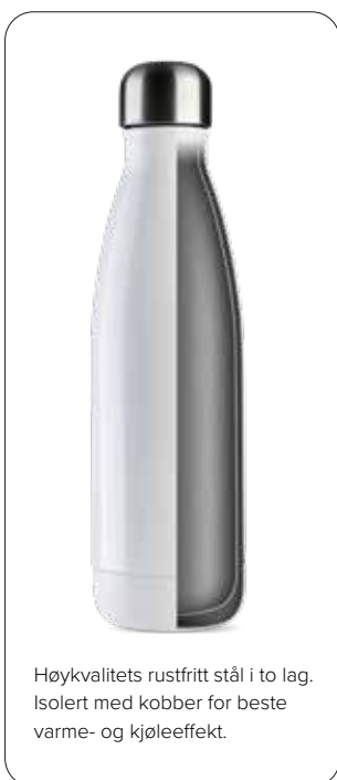
Høykvalitets rustfritt stål i to lag. Isolert med kobber for beste varme- og kjøleeffekt.